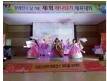
■ 재미있는 공연도 관람하고~