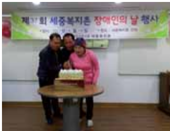
장애인의 날 축하합니다~

2017년 4월 20일 제37회 장애인의 날을 맞이하여 하루 전날인 4월 19일에 기념 행사를 진행하였습니다. 지난해 여름 캠프 이후 세종복지재단과 세종 보호작업장 식구들이 모두 한자리에 모여 친목을 다지는 기회가 될 수 있었습니다. 또한 봉사자분들도 함께 어울려 즐거운 시간이었습니다. 그 어느 때보다 웃음과 활기가 넘치던 그날의 모습을 함께 만나 볼까요?