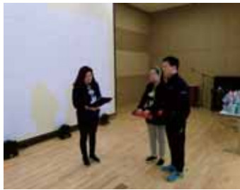
■ 우수직원과 우수이용인 시상식