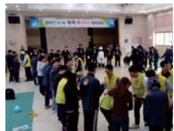
■ 함께 해주신 봉사자분들 감사합니다♡