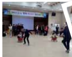
■ 아슬아슬 누가 이길까요~?