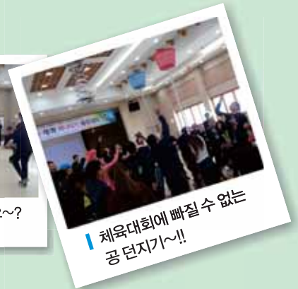
■ 체육대회에 빠질 수 없는 공 던지기~!!