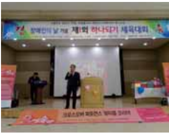
■ 군수님께서 방문해 주셨어요