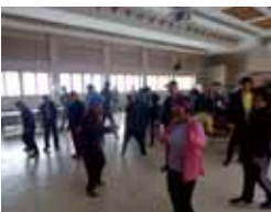
■ 신나는 댄스타임