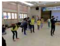
■ 서로서로 손을잡고 훌라후프 통과하기!!