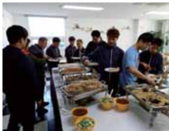
점심식사는 아워홈에서 준비해 주신 맛있는 뷔페