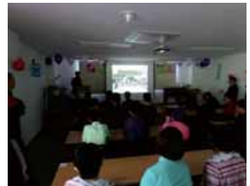
1년 동안 우리들의 모습을 영상으로 만나보았어요