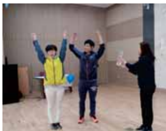
■ 우승은 청팀~!!